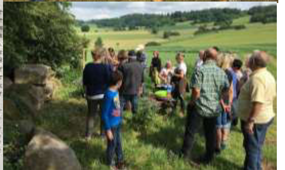
Die Natur- und Landschaftsführer zogen mit ihren spannenden Informationen die Besucher an der Geologischen Baumhecke in ihren Bann.